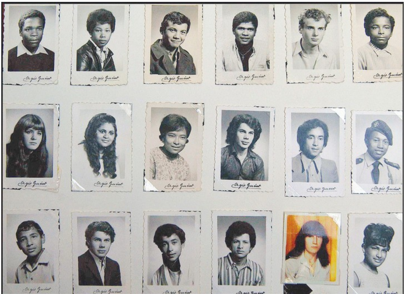
Liste d'enfants réunionnais de la Creuse

Ce que de nombreuses personnes appellent « la déportation des enfants de la Réunion » est encore peu connue. Affaire étouffée par le Gouvernement ? Sûrement. On change leur prénom et coupe tout lien avec leur famille biologique. Parfois maltraités dans leurs familles d'accueil, c'est une histoire traumatisante pour les petits réunionnais qui, une fois grands, ne gardent aucun souvenir de leur ancienne vie sur l'île.