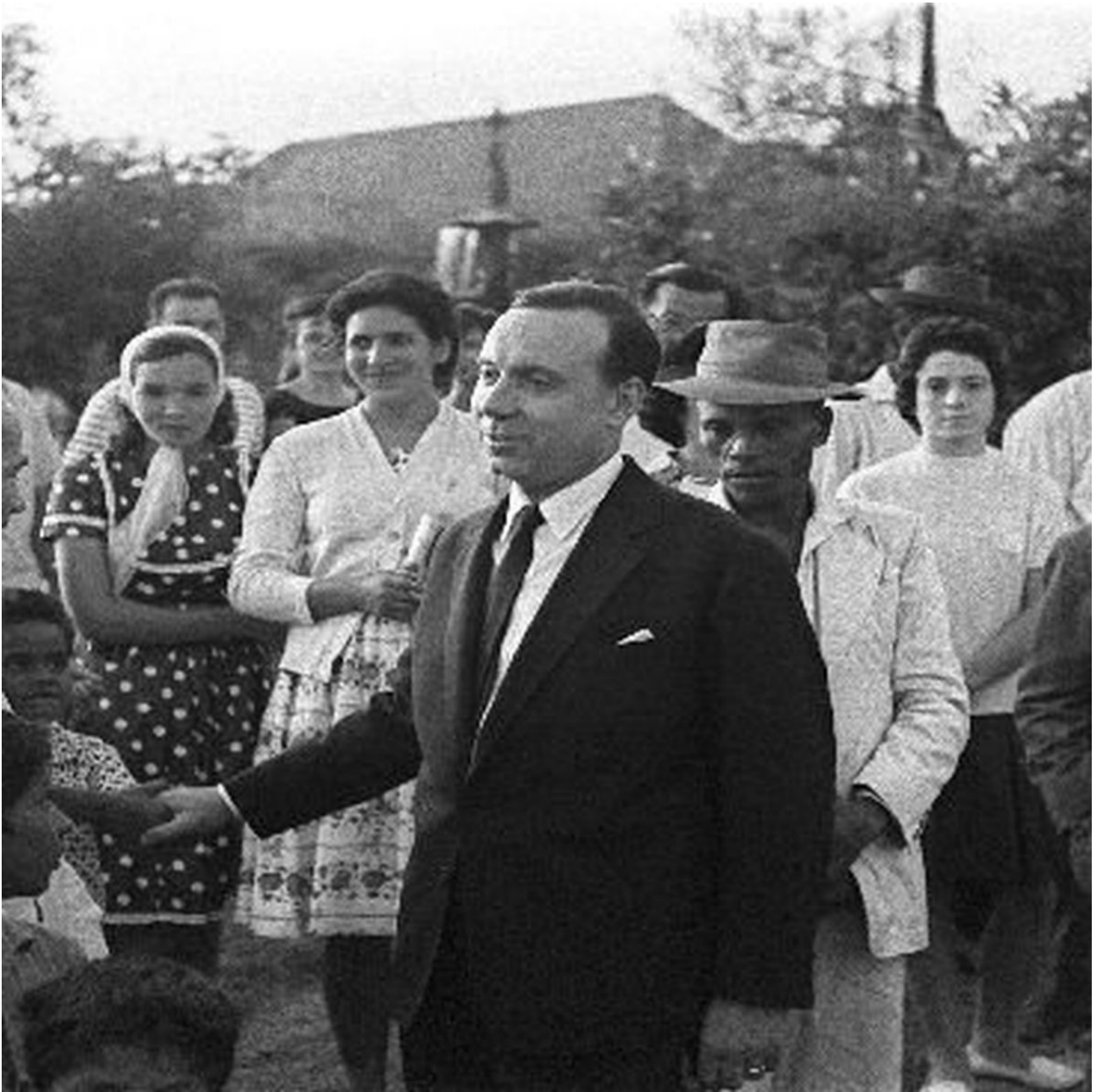
Michel Debré sur l'île de la Réunion à la rencontre des habitants de la Réunion

métropolitaine s'expose à un autre problème. Suite à un violent exode rural, les campagnes se retrouvent désertées. En Creuse, les habitants manquent de bras pour les récoltes. Pour Michel Debré, difficile de ne pas trouver de lien. On prend là où ça déborde afin de combler les vides dans d'autres endroits. Affaire résolue.